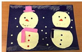
『自分で雪を描き足しました』