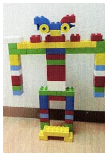
『レゴブロックで 作ったロボット』