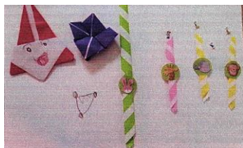
『折り紙でサンタクロースの キャンディー屋さん』