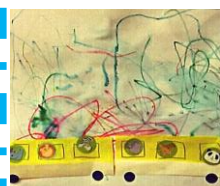
『動物列車に サインペンを にじませて雨を 降らせました』