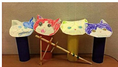
『大好きな妖怪ウォッチの的を作り ゴムでつぽうに挑戦！』