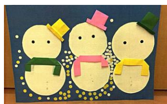
『お父さん・お兄ちゃん・自分』 (前日にお母さん・自分を作りました)