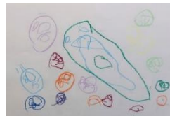
線や曲線、丸に変化